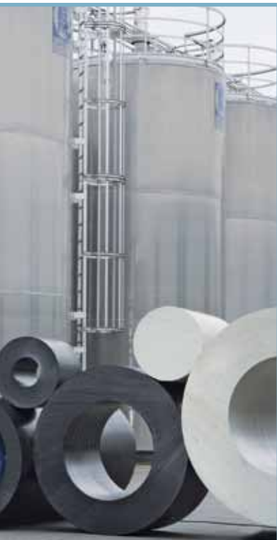
Hohl- und Vollstäbe Hollow bars and solid rods